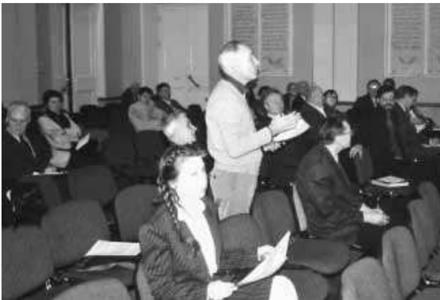
Im Konferenzraum des Wernadskij-Museums waren über 50 führende russische Wissenschaftler zusammengekommen, darunter viele Physiker, Biologen und Wirtschaftswissenschaftler.

So gab es zum Beispiel für den „Steinzeitmenschen“ den Begriff „Eisenerz“ nicht. Ähnlich gab es vor der Entdeckung der Kernspaltung den Begriff „Uranbrennstoff“ nicht; dennoch läßt sich in heutigen Kernreaktoren aus 1 kg Uran das Wärmeäquivalent von 50 000 kg Kohle gewinnen. Ähnlich verwandelt sich das in den Weltmeeren vorkommen-