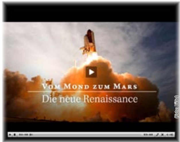
Titel des neuen BüSo-Films: „Vom Mond zum Mars – Die neue Renaissance“

Was oligarchischer Knechtschaftssinn getrennt hat, wird im Kontext der zivilisatorischen Krise wieder vereint: Kultur mit Wissenschaft, diese mit Moral und nicht zuletzt mit Politik. Das Video mit dem Titel „Vom Mond zum Mars: Die neue Renaissance“ finden Sie auf der Internetseite der BüSo unter www.bueso.de/node/8662 . Helfen Sie dieses Video verbreiten und diskutieren Sie darüber mit Ihren Freunden und Kollegen!