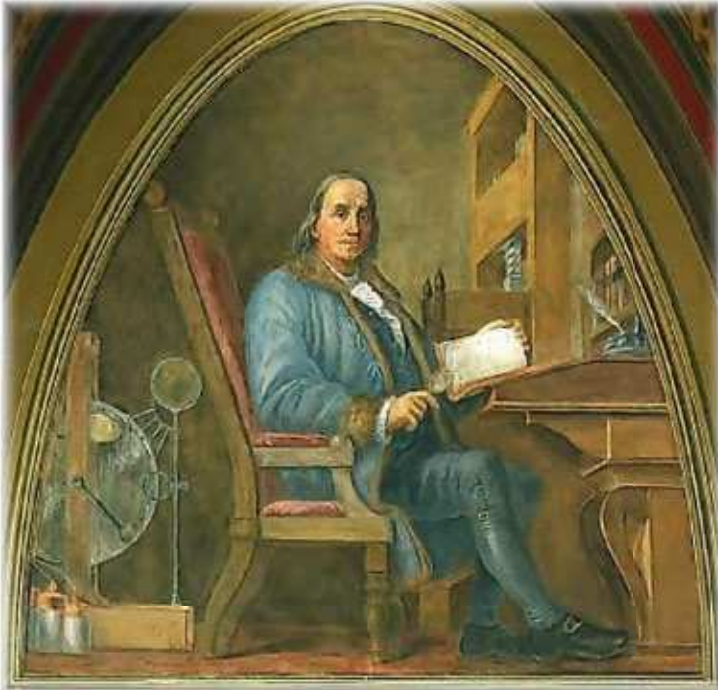
Benjamin Franklin (1707-90), Philosoph, Wissenschaftler, Erfinder, Drucker, Musiker, Ökonom und Staatsmann, führte das Vermächtnis der Winthrops und Mathers fort, indem er die Einführung einer „Papierwährung“ nach dem Vorbild des Pinetree Shilling der Massachusetts Bay Colony plante.

einigten Staaten in dieser Hinsicht unter den Präsidenten Andrew Jackson, Theodore Roosevelt, Woodrow Wilson, Calvin Coolidge, und die allerschlimmsten unter George W. Bush und Barack Obama.