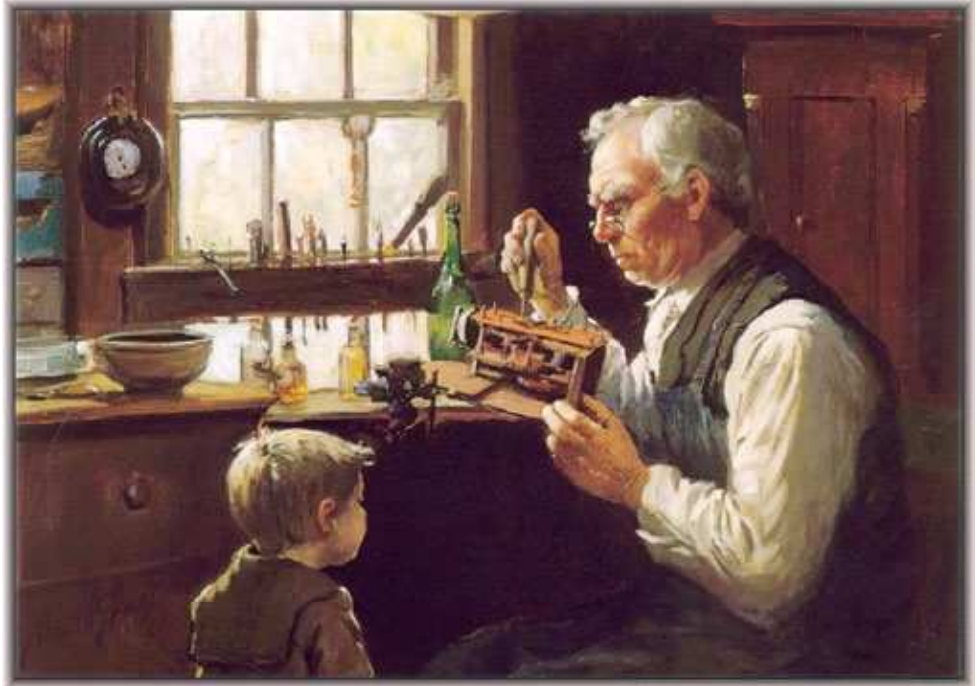
„Die Wahrheit liegt immer in der Ordnung der übergeordneten Prozesse, die sich in Begriffen des unmittelbar Erlebten ausdrücken lassen. ‚Die Uhr hat einen Uhrmacher‘, einen, dessen Ausdruck die Sehnsucht nach einer höheren Seinsordnung als jener ist, die wir in unseren Sinneswahrnehmungen von uns selbst erleben.“ Im Bild The Village Clockmaker von Abbott Fuller Graves.

Wahre Souveränität liegt nicht in der öffentlichen Meinung, und gewöhnlich liegt die öffentliche Meinung gefährlich daneben; wahre Souveränität liegt in den schöpferischen Geisteskräften des menschlichen Individuums.