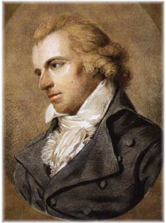
„Das Drama Hamlet ist keine Torheit Shakespeares, sondern wie Friedrich Schillers Warnung in seinem Wallenstein an alle, die nicht den Westfälischen Frieden würdigen, so zeigt Hamlet die Torheit, die uns alle erfassen kann.“ Links William Shakespeare (1564-1616), rechts Friedrich Schiller (1759-1805).