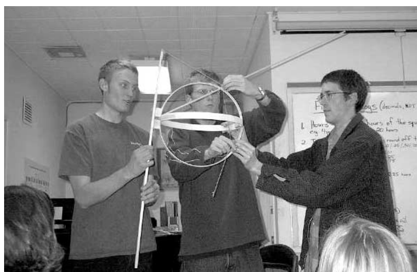
Die LaRouche-Jugendbewegung leistet Pionierarbeit auf pädagogischem Gebiet, hier bei der gemeinsamen Arbeit an einem geometrischen Modell.

► Eines der großen Probleme Deutschlands sind die nach 30 Jahren, in denen der Ausbau der Verkehrsinfrastruktur aus ideologischen und finanziellen Gründen verschleppt worden ist, in vieler Hinsicht unzureichenden Verkehrskapazitäten. Davon ist auch Wiesbaden betroffen, und daran hat auch der Bau der ICE-Linie Frankfurt-Köln nichts Grundsätzliches geändert.