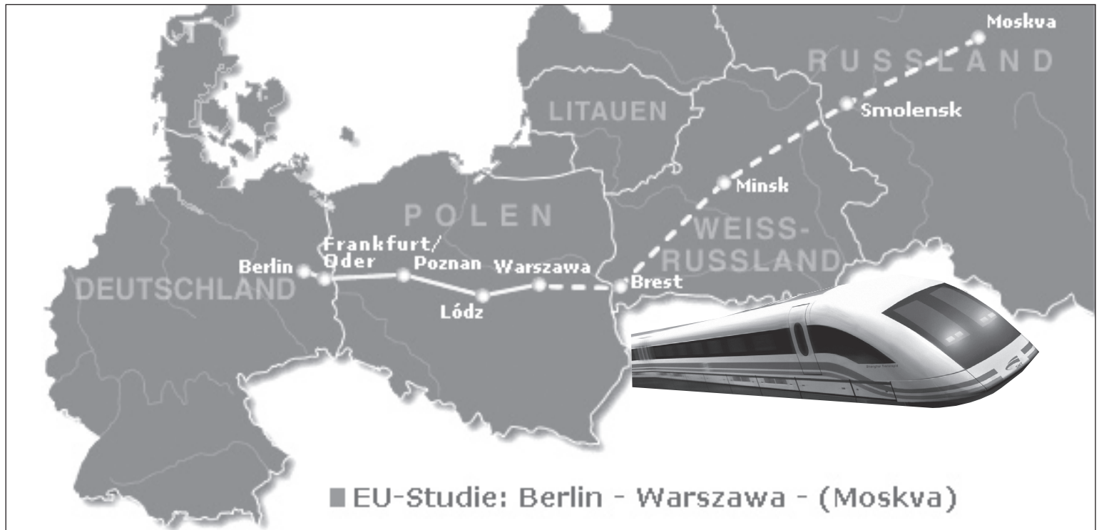
Die EU ließ 1998 eine Machbarkeitsstudie der Transrapidstrecke Berlin-Moskau erstellen. Gebaut wurde dann aber nichts.

Flughafen muß durch Transrapid mit Berlin verbunden werden.